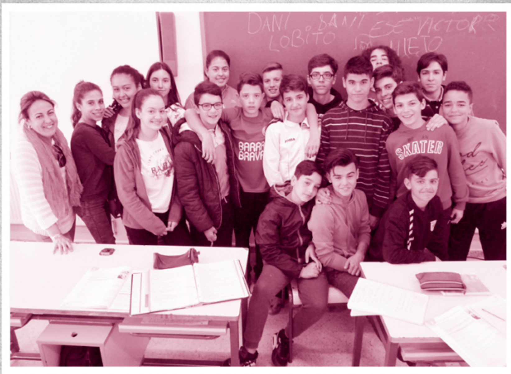
2º ESO [B] TUTORA: Milagros Lucero